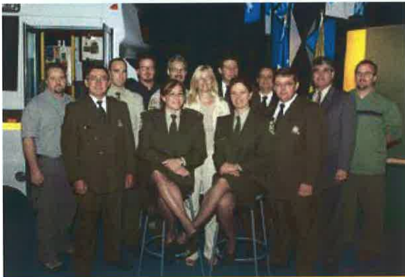
Des membres de la Sûreté du Québec devant le stand

La Sûreté a d'ailleurs fait bonne impression. Plusieurs centaines de congressistes ont visité son stand. Le nouveau poste mobile de proximité qui était aussi sur les lieux a suscité un vif intérêt de la part des représentants municipaux. Les participants ont également pu rencontrer des membres du groupe d'intervention tactique et des unités d'urgence.