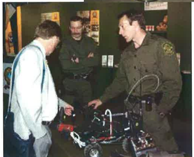
Des membres du groupe d'intervention tactique